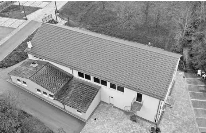
Auf dem Dach der Kultur- und Sporthalle Zaisenhausen entsteht ein Solarkraftwerk.

Mit einer Beteiligung unterstützen die Einwohnerinnen und Einwohner auch die Energiewende hin zu einer klimafreundlichen Stromerzeugung und tragen zur wirtschaftlichen Stärkung der Region bei. Pro Person ist ein Anlagebetrag von 100 bis zu 10.000 Euro möglich – auch für Partner, Kinder und Enkel. Interessenten können den gewünschten Betrag einfach per E-Mail an kontakt@buergerenergie-durmersheim.de mitteilen. Eine BEG-Mitgliedschaft ist auch über die Website möglich: www.buergerenergie-durmersheim.de .